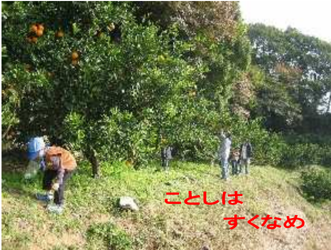
ことしは すくなめ