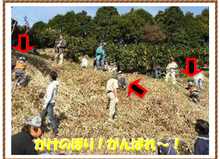
かけのほり！がんばれ〜！