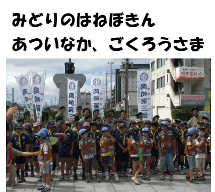
みどりのはねぼきん あついなか、ごくろうさま